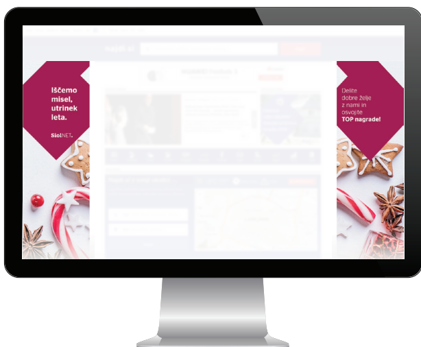
Primer vidnosti oglasa obiskovalca s širino zaslona 1920 px :